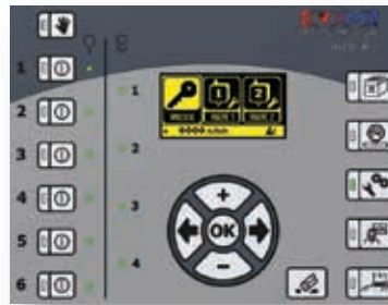
Ventil Ein / Aus