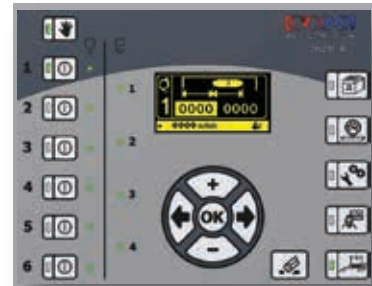
Leimbild | Anzeige