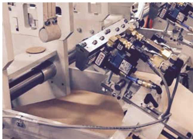
Dosierung von Kalt- und Heißleimen